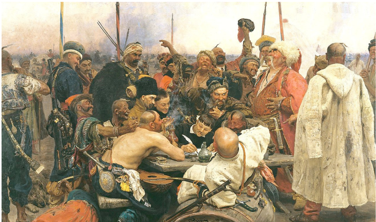
Afbeelding 4 - Kozakken

Hij bekende zijn vader dat hij de veldtocht bijzonder uitputtend vond. Al dat gedraaf, en maar geen gevechten. Het is zo'n pech; ons regiment heeft echt de behoefte om zichzelf te onderscheiden en we zoeken allemaal de mogelijkheid daartoe, maar tevergeefs. Ik heb nog geen idee wanneer we terugkomen. Het is onmogelijk dat deze campagne minder dan een jaar gaat duren, en het is een bijzonder vooruitzicht de winter door te brengen in dit land van beren en wolven.