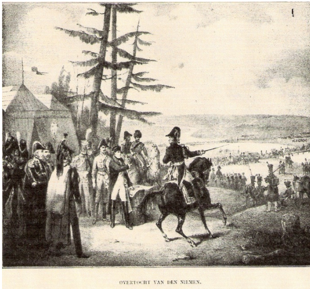
Afbeelding 3 - Veldtocht naar Rusland

Op grond van zijn uitvoerige voorbereiding en zijn grote Grande Armée van 500.000 man had Napoleon gehoopt op een snelle veldtocht door Russisch Polen en een overwinning op het Russische leger. Toen Rusland merkte hoe groot het leger van Napoleon was, trokken zij zich terug. Napoleon ontmoette aanvankelijk dan ook weinig weerstand en trok snel het vijandelijk gebied in. De Russen pasten de tactiek van de verschroeide aarde toe, d.w.z. troepen trokken zich terug, voorraden werden weggehaald en waterputten werden